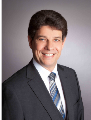
Klaus Schumacher Bürgermeister